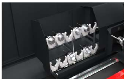
Batentes pneumáticos 05